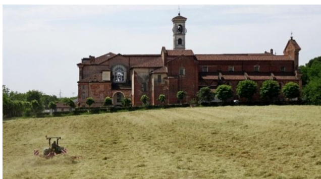
Abtei Casanova