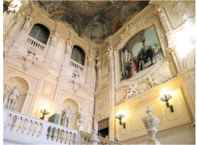
Turin - Palazzo Madama

Der Nachmittag und Abend steht zur freien Verfügung. Wer möchte, kann den spektakulären Aufzug des Filmmuseums zur Aussichtsplattform benutzen oder auch dem Ägyptischen Museum (beides fakultativ) einen Besuch abstatten.